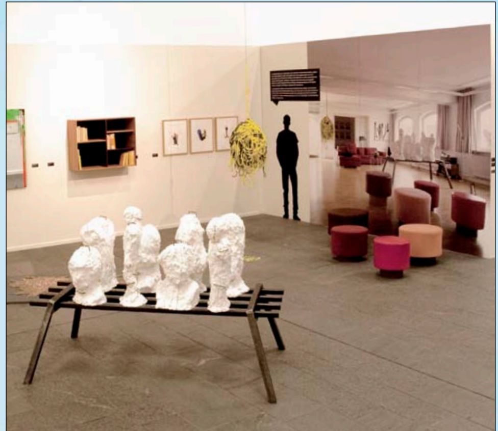
Das Entrée zur Ausstellung