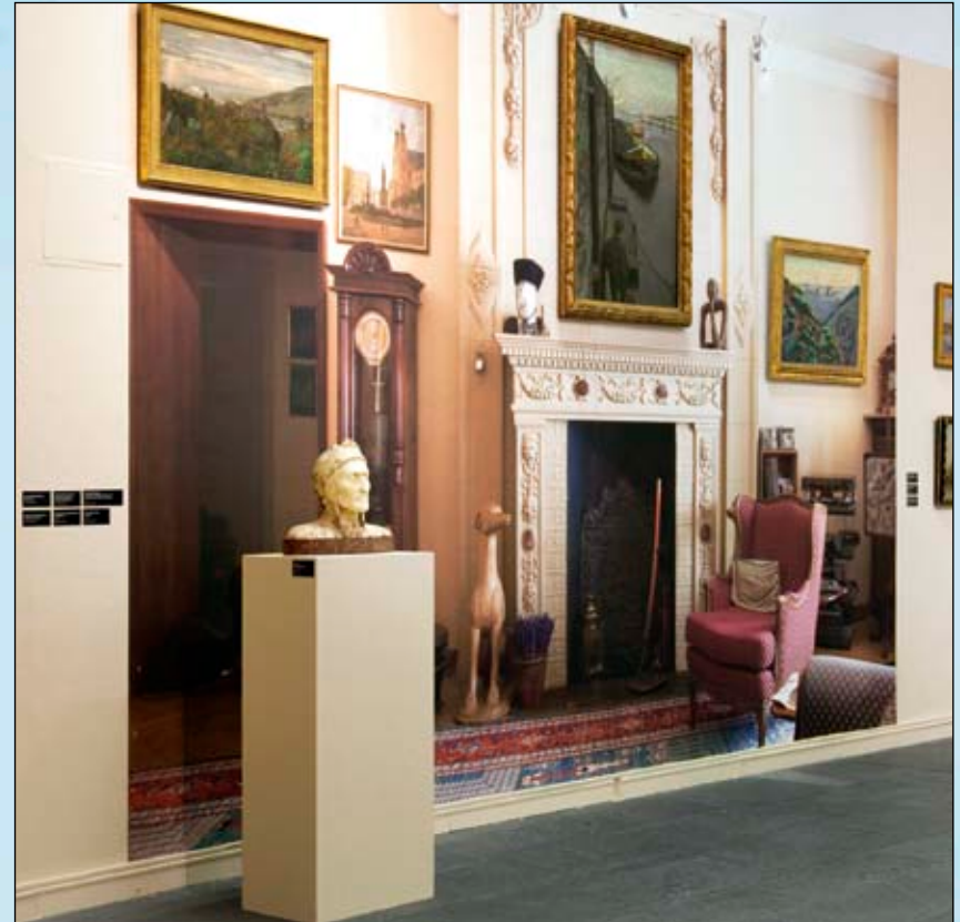
Die Originale der Kunstwerke wurden auf die gedruckte Fototapete gehängt.