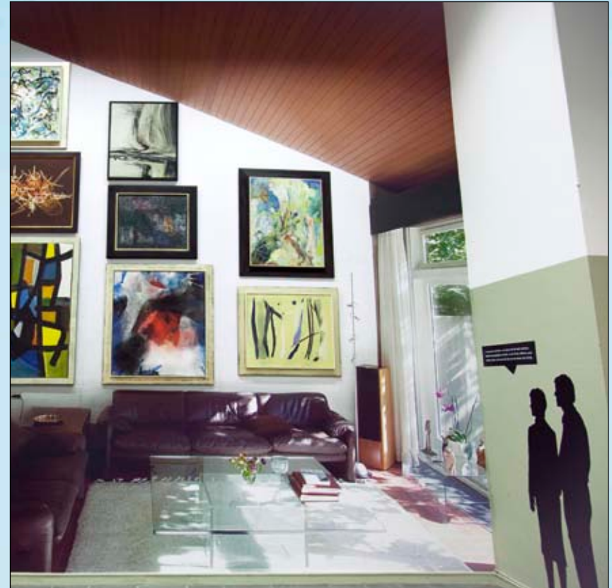
Die Originale der Kunstwerke wurden auf die gedruckte Fototapete gehängt.