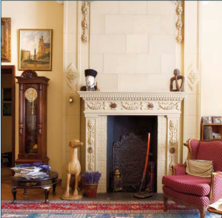
In der Druckdatei wurden die Gemälde entfernt.

11 Innenraumaufnahmen zeigen die Privatdomizile der gesammelten Kunstobjekte – und Gemälde. Teilweise wurden die Exponate als Original in die Fototapete integriert oder neben der Fotowand platziert.