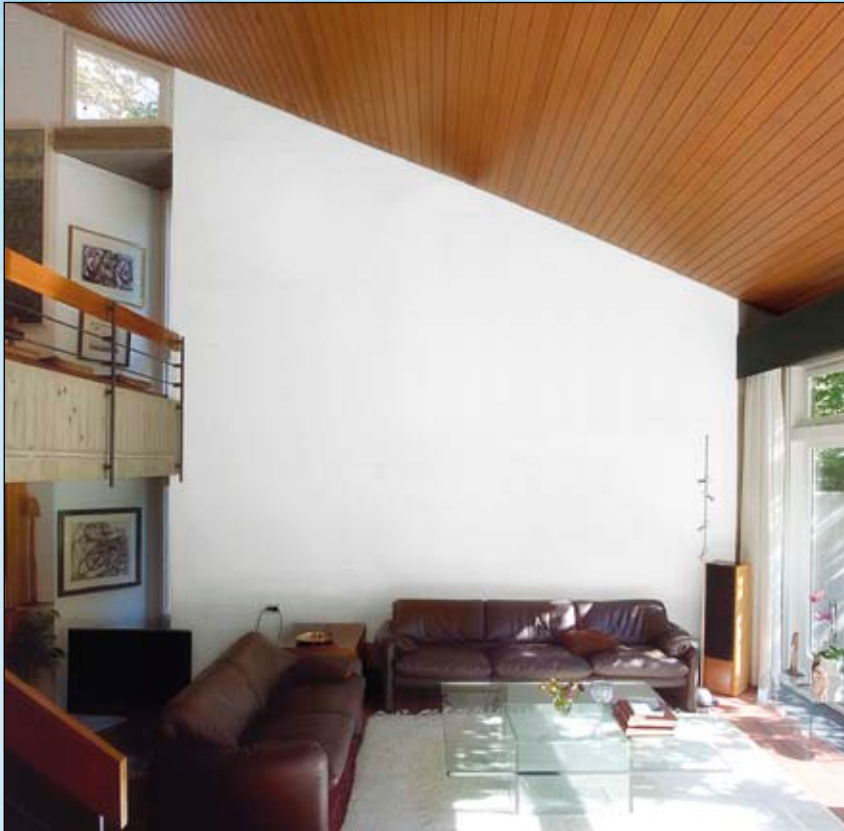
In der Druckdatei wurden die Gemälde entfernt.

Bis zu 6 Meter hohe und 6 Meter breite Tapetenwände erzeugen eine dreidimensionale Wirkung der Originalschauplätze.