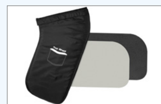
Deckelplatte in Schwarz, Silber oder Stein