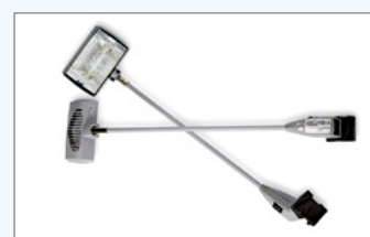
Halogen-Spots, 120 W, 2er-Pack