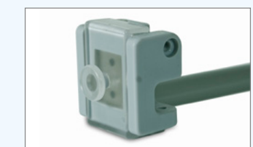
Flag Clips f. Wechsel zw. Magnet- und Textilbahnen