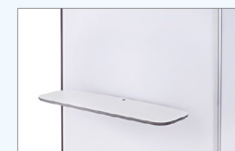
Regal-Set für Zuladung bis max. 6,65 kg **