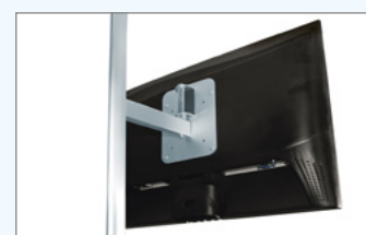
Monitorhalter für Bildschirme bis max 8 kg*