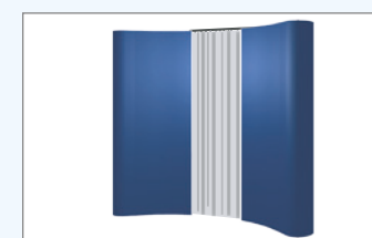
Vorhangprofil z. B. für Backstage-Bereich