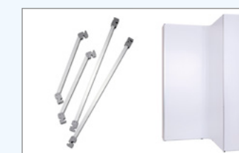
Set f. Eckelement als Verbindungsstück